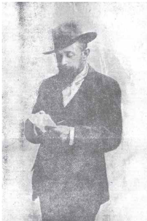
Figura 1. Juan Bautista Amorós (Silverio Lanza), presidente de la APOG y de la SGE

señanzas que propone el Sr. Vincenti. Pero hay una ventaja a favor de los franceses, y consiste en que los batallones escolares pueden producir soldados útiles, y nuestra gimnástica oficial, sin esfuerzos ni peligros, producirá niños cobardes que no pueden ser útiles para nada. (Amorós, 1894, p. 124).